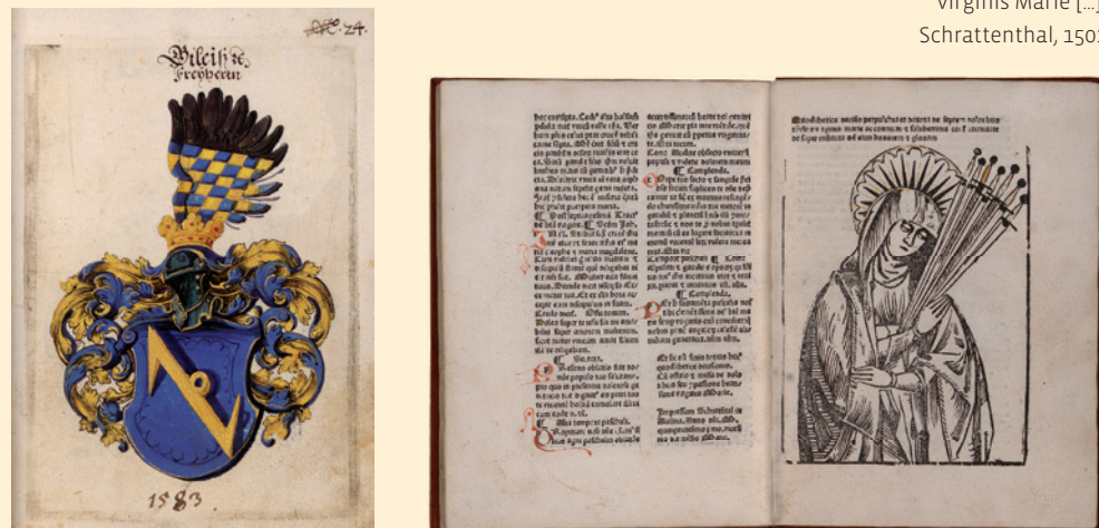
NÖ Landesbibliothek Michel François: Quodlibetica deciso perpulchra et devota de septem doloribus christifere virginis Marie [...], Schrottenthal, 1501

Wir bewahren „Aufhebungswertes“ über Jahrhunderte! Das Archiv sichert Urkunden und Bücher seit dem Mittelalter, es übernimmt regelmäßig „archiwürdige“ Verwaltungsakte und sammelt Dokumente zur Landesgeschichte. Bücher, Bilder und Karten wiederum gelangen auf oft verschlungenen Wegen in die Bibliothek – sie stehen im Dienst wissenschaftlicher Informationsvermittlung.