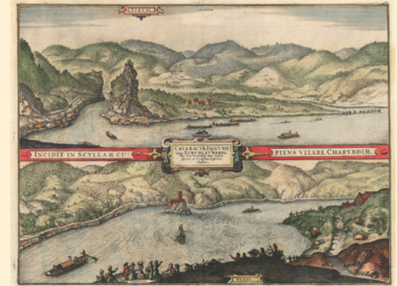
Donaustrudel und Donauwirbel, Kolorierter Kupferstich, 1657

DIE ZÄHMUNG DER DONAU ist ein gemeinsam behandeltes Thema. Wie der Fluss trennt, verbindet und weiterfließt, arbeiten Archiv und Bibliothek auf getrennten Wegen an einem gemeinsamen Ziel: Aufhebenswertes zu bewahren und in die Zukunft weiterzugeben.