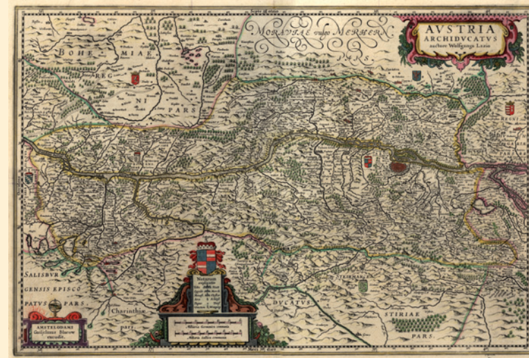
NÖ Landesbibliothek Wolfgang Lazius: Niederösterreich um 1545, Nachdruck 1649