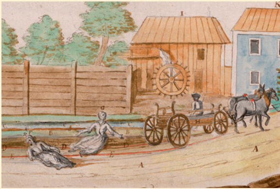
Ein Verkehrsunfall mit tödlichem Ausgang, 1778