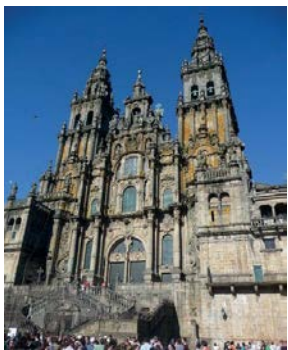
Kathedrale in Santiago de Compostela

Herbert Hirschler , geb. 8.11.1965 in Sieding/Ternitz, NÖ, ist als Musik- und Textautor für bisher ca. 600 Titel im Bereich der volkstümlichen Musik und des deutschsprachigen Schlagers verantwortlich und