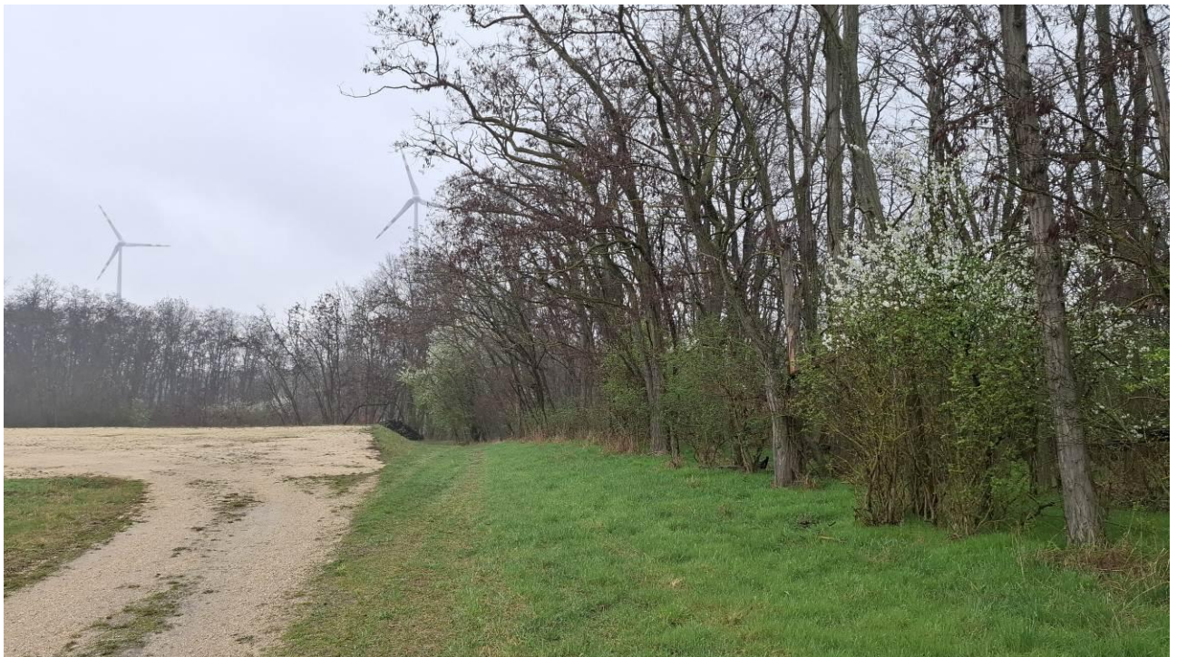
Abbildung 2: Typischer Gehölzrand ohne Saum oder Struktur am 29. März 2025.

In der Betriebsphase kommt es zu einem Weiterbestand der Entwertung des Lebensraumes im Eingriffsgebiet, vor allem für Großvogelarten, also zu einer Prolongation des Revierflächenverlustes. Hierfür ist als Kompensation projektimmanent die Neuanlage von Nahrungsflächen vorgesehen.